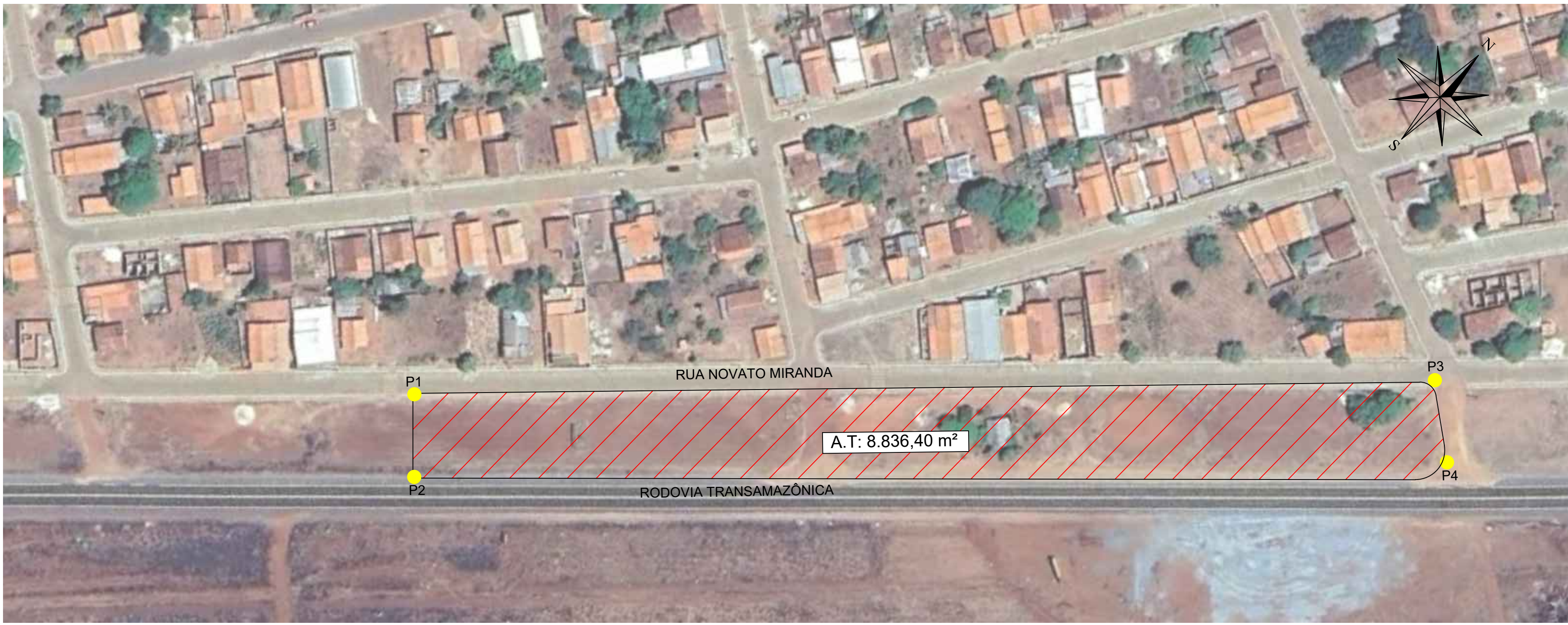
MAPA DE SITUAÇÃO ESC: 1/1000